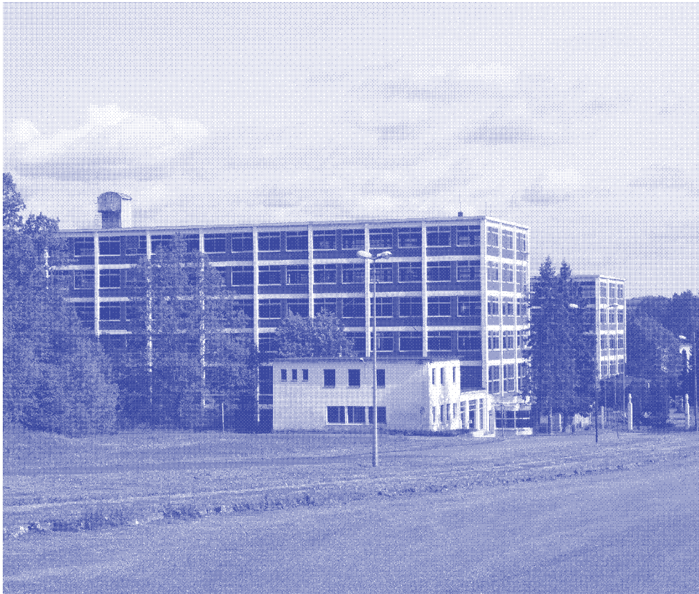
Site de production de Bataville, Parc naturel régional de Lorraine.